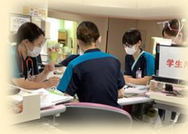
口腔ケアカンファレンス